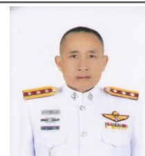
ร.ต.อ.บุญนาคา ราศรีไส รอง สวป.สภ.เหล่าต่างคำ/กต.ตร.