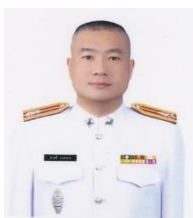
พ.ต.ท.ชาตรี วงศ์เทพ สว.สส.สภ.เหล่าต่างคำ/กต.ตร.