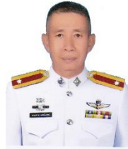
ร.ต.ท.ชาญชาย แสนโกชน์ รอง สว.(ป.)สภ.เหล่าต่างคำ เลขานุการ กต.ตร.